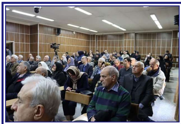
حضور باشکوه اساتید پیش‌کسوت در مراسم نکوداشت

قابل ذکر است که این مراسم باشکوه با همکاری ارزنده گروه ریاضی کاربردی دانشکده علوم ریاضی، مرکز آثار مفاخر و اسناد دانشگاه فردوسی مشهد، بنیاد دانشگاهی فردوسی و بنیاد ملی نخبگان استاد خراسان رضوی برگزار گردید.