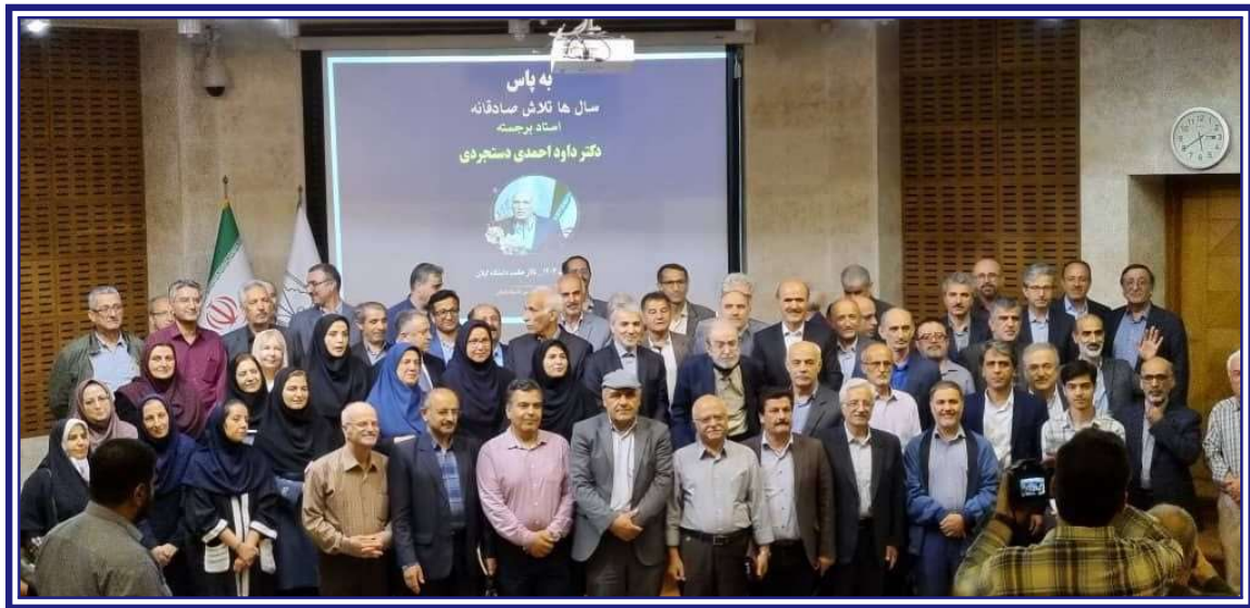
جمعی از شرکت‌کنندگان در مراسم نکوداشت

۳. در چهل‌وششمین دوره مسابقه ریاضی دانشجویی کشور که از ۱۱ لغایت ۱۴ اردیبهشت ۱۴۰۳ در دانشگاه تبریز برگزار شد،