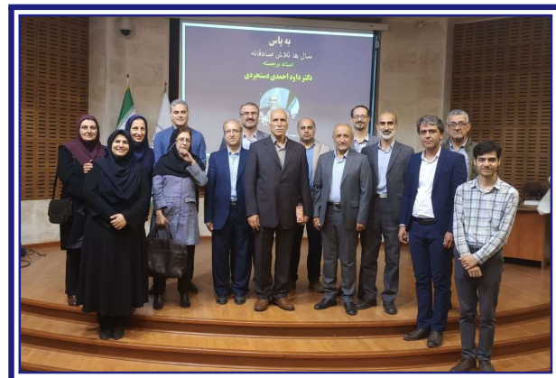
جمعی همکاران دانشکده علوم ریاضی در مراسم نکوداشت